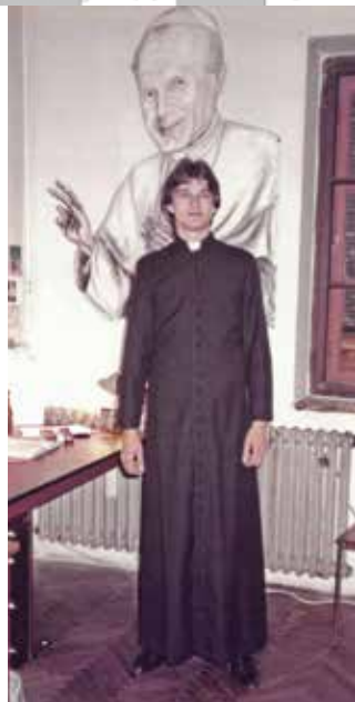
Als 20-Jähriger im Priesterseminar

W.S.: Vilim, ich glaube, wir sind gerade auf dem Weg, den Glauben wieder neu und intensiver zu entdecken. Ich danke dir für das Interview. Zu deinem Priesterjubiläum gratulieren wir dir herzlich, erbitten für dich Gottes Segen und sind sehr dankbar für dein priesterliches Wirken nicht nur in der kroatischen Gemeinde, sondern auch für alle Menschen in unserer Stadt.