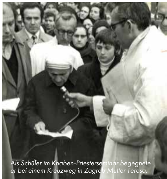
Als Schüler im Knaben-Priesterseminar begegnete er bei einem Kreuzweg in Zagreb Mutter Teresa.