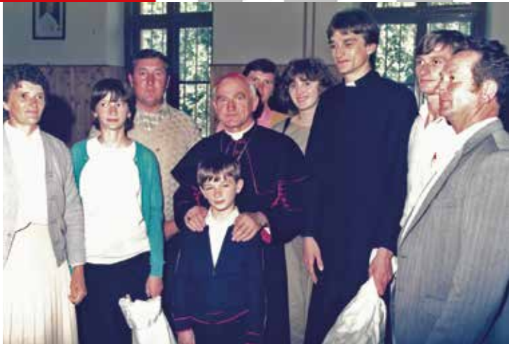
1986 bei der Diakonweihe mit Kardinal Franjo Kuharic und im Kreis seiner Familie