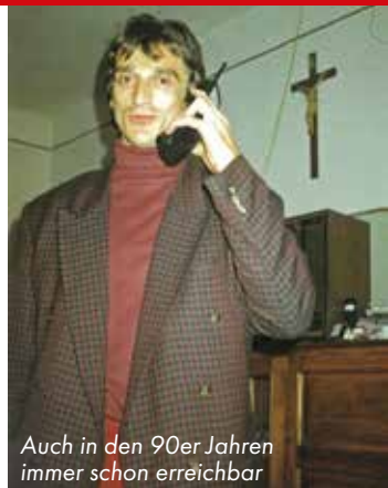
Auch in den 90er Jahren immer schon erreichbar

der Gemeinde: Kirchenrenovierung, Gemeindehaus und Pfarrhaus, 26 Stunden pro Woche Religionsunterricht, Gottesdienste, intensive Seelsorge etc. Natürlich war ich jede freie Minute selbst auf den Baustellen zur Mitarbeit. Um mich aufrecht zu erhalten, rauchte ich in dieser Zeit viel, 60 Zigaretten am Tag und schließlich bekam ich aus Erschöpfung den totalen Zusammenbruch. Während des Gottesdienstes brach ich zusammen und kam ins Krankenhaus: Intensivstation. Diagnose: Darmgeschwüre, Blutvergiftung, totale Erschöpfung. Langsam päppelte man mich wieder auf. Ich war 36 Jahre alt, und eine Ordensschwester tröstete mich: „Weißt du, du kannst mit der Krankheit gut noch 10 Jahre leben.“ Es war ernst.