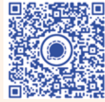
QR-Codes zum Beitritt in die Gruppe „WirsindGemeinde“ in der Signal-Messenger-App