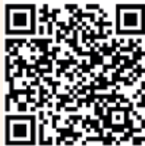
QR-Code zum runterladen der Signal-Messenger-App im Appstore bei Google (Android)