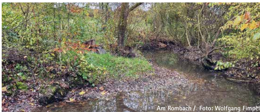
Am Rombach