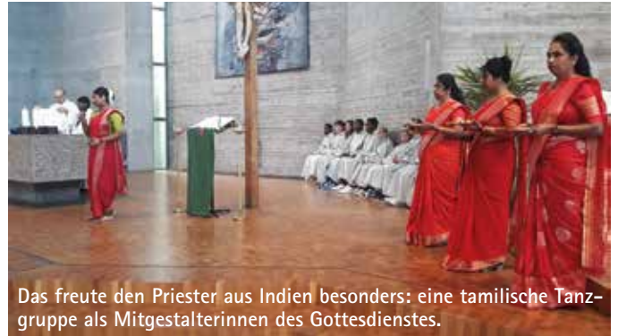
Das freute den Priester aus Indien besonders: eine tamilische Tanzgruppe als Mitgestalterinnen des Gottesdienstes.