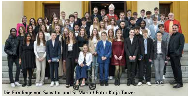
Die Firmlinge von Salvator und St. Maria