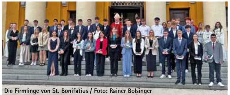
Die Firmlinge von St. Bonifatius