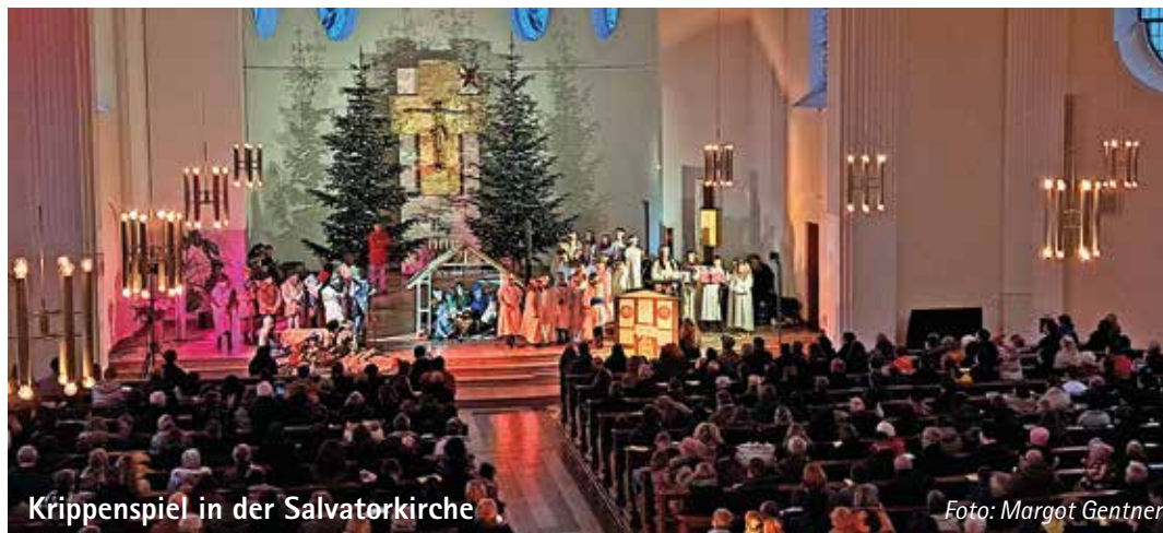
Krippenspiel in der Salvatorkirche