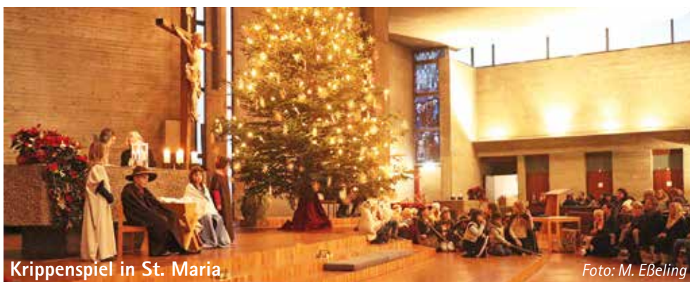
Krippenspiel in St. Maria