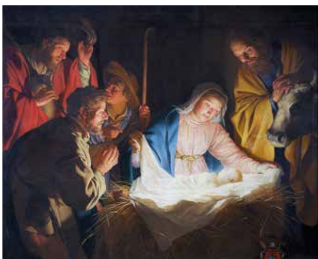
Gerrit van Honthorst – Anbetung der Hirten (1622)

Es gibt diese barocken Weihnachtsgemälde, wo sich die Menschen über das Jesuskind beugen und von seinem Licht illuminiert werden. Das ist kitschig, aber es trifft die Sache: Ein Kind kommt in die Welt und tut den ganzen Tag nichts anderes, als aus seiner Krippe herauszustrahlen und jeden froh zu machen, der seine Nase hineinsteckt. Wie genial ist doch der große Gott, dass er als kleines Baby auf