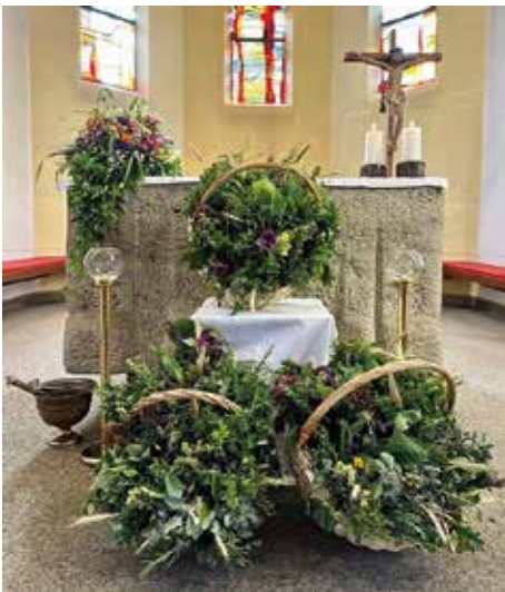
Kräuterbüschel – hier von St. Bonifatius – zu Mariä Himmelfahrt