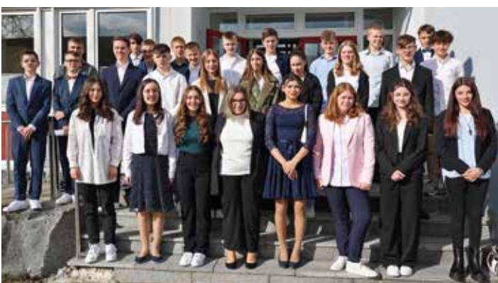
Die Firmlinge von St. Bonifatius