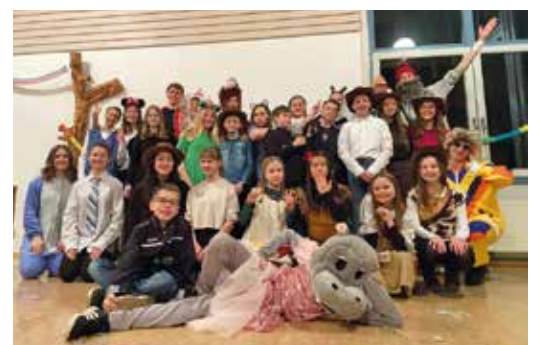
Minifasching in der Weststadt 2023