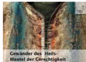
Gewänder des Heils – Mantel der Gerechtigkeit

Montag, 11. April, um 18.30 Uhr in St. Bonifatius