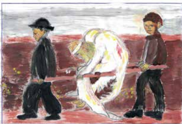
Nach einem Gemälde von Hugo Simberg, Finnland 1903

sagt wurde. Warum blute ich am Flügel? Haben mich die jungen Hirten geschlagen? Bin ich gestürzt inmitten des Jubels? Kommt, macht euch auf zum göttlichen Kind. Der Frieden unter euch