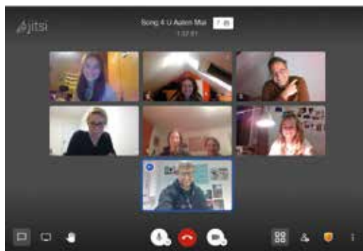
Gottesdienstvorbereitung Online

Manchmal, wenn ich einem Freund in die Augen sehe, dann habe ich ein Gespür dafür, ob wirklich alles okay ist. Das kennen Sie bestimmt auch von Menschen, die Ihnen am Herzen liegen. Bei denen man direkt merkt,